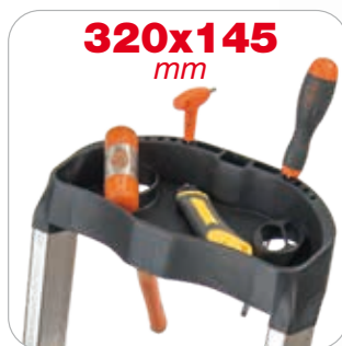
Porta utensili e presa della mano

La doppia inclinazione significa strategica aderenza al punto di lavoro